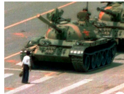
USA, Charlie Cole

Het komt regelmatig voor dat een regime of een organisatie niet wil dat er journalisten en persfotografen komen om vast te leggen wat er gebeurt. In sommige landen moeten persfotografen zich registreren als ze er naar binnen gaan. Zo kan de overheid in de gaten houden in welke zaken ze hun neus steken. Soms worden persfotografen het land weer uitgestuurd, soms worden ze gevangen gezet of ontvoerd. Reporters without Borders houdt op hun website www.rsf.org bij hoeveel journalisten er jaarlijks vermoord worden. Vorig jaar stierven er 67 journalisten in het harnas. Drieënveertig journalisten stierven onder onduidelijke omstandigheden. Nog eens 27 niet-professionele burgerjournalisten werden vermoord.